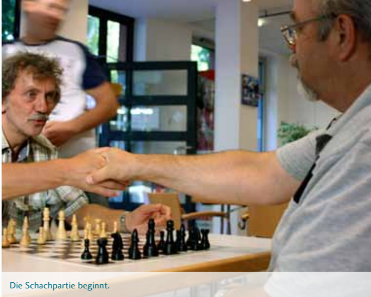
Die Schachpartie beginnt.